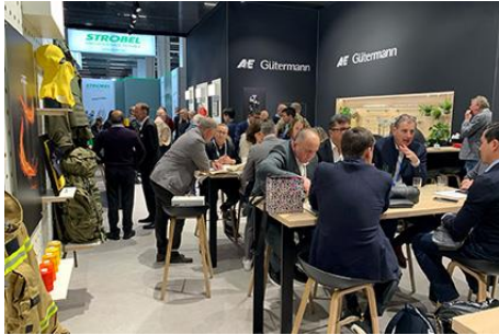
Texprocess 2024 - Impressionen