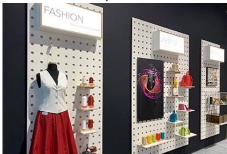
Texprocess – Themenwelten Fashion, Lifestyle, Heritage