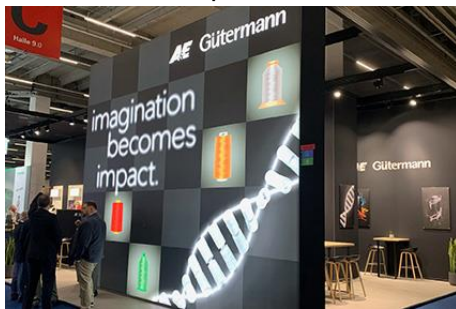
Texprocess – Future – imagination becomes impact