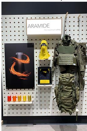
Texprocess – Themenwelt Aramide – for maximum safety