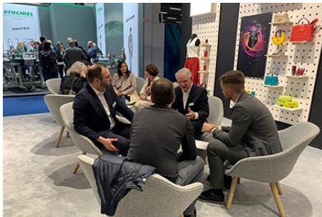
Texprocess 2024 - Impressionen