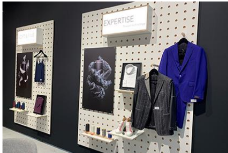
Texprocess – Themenwelt Expertise - Thread Technology