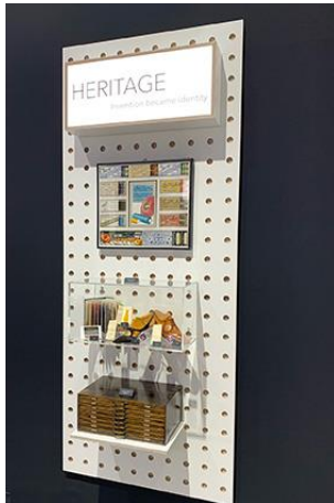
Texprocess – Themenwelt Heritage - invention became identity