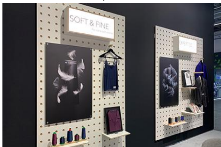
Texprocess – Themenwelten Soft & Fine, Expertise