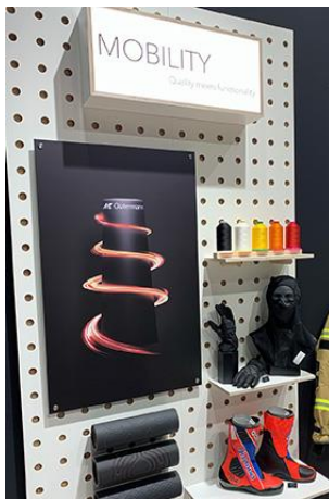
Texprocess – Themenwelt Mobility - Quality meets functionality