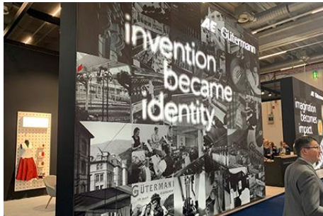
Texprocess – Heritage – Invention became identity