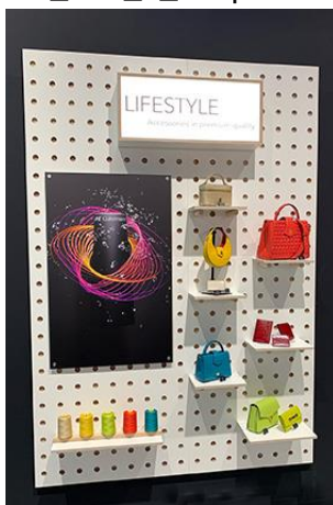
Texprocess – Themenwelt Lifestyle - Accessories in premium quality